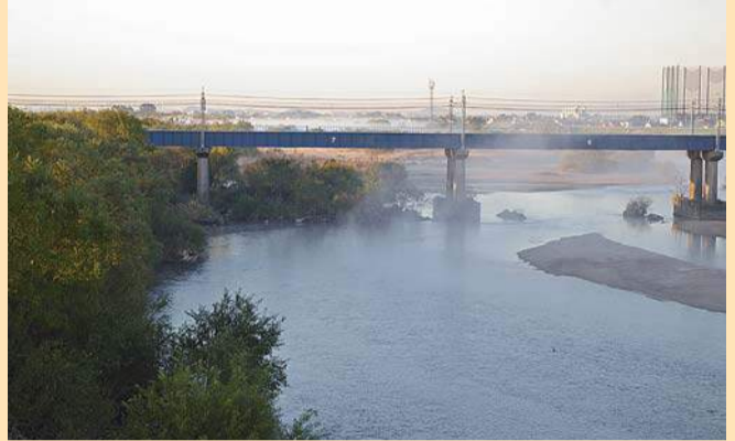
カクキューの西側に流れる矢作川

八丁味噌は、いくつものかけがえのない要因が重なったからこそ成り立っている。 八帖町(旧八丁村)は、矢作川、早川、菅生川(乙川)に挟まれた中洲のような立地であり、こうした温気が多い風土に棲みつく微生物もたまたま環境が、味噌の味に影響を与えてきた。八丁味噌とは、このような環境に適応して昔ながらの木桶仕込み、天然醸造で長期熟成させる味噌のことだ。 江戸時代から行われてきたように、今でも木桶を使い続け、6トンの仕込み量に対して約3トンの重石を、職人の手によっていねいに、田舎に積み上げていく。この状態で「夏一冬(2年以上)天然醸造で熟成させる」