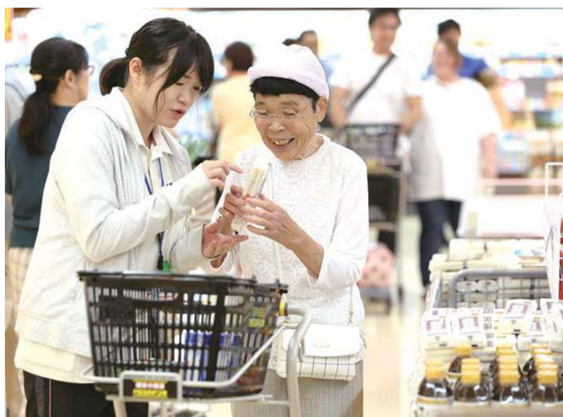
スタッフ同伴で買い物する「買い物リハビリ」