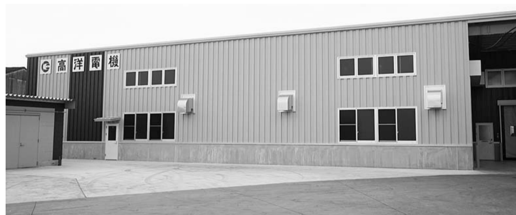
高洋電機の第4工場

海外市場の開拓にも挑戦している。7月中旬には、米国・サンフランシスコで開かれた半導体関連の展示会「SEMICON WEST」に出展した。自社技術をアピールし、現地企業から多くの引き合いを獲得している。