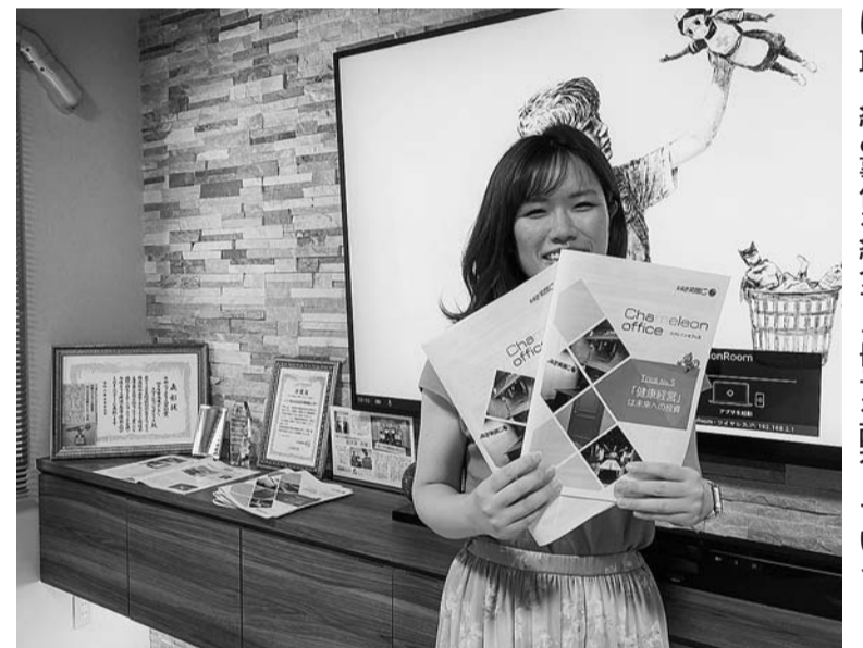
四日市事務機センターの体験型オフィスツアーでは取り組み事例を紹介する冊子を配布している

の導入、会議を効率化する大型タッチディスプレイなど50事例を提案している。いずれも導入コストや導入に要する期間、導入前と導入後の効果まで具体的に提示、生産性向上に役立つノウハウが集約されている。