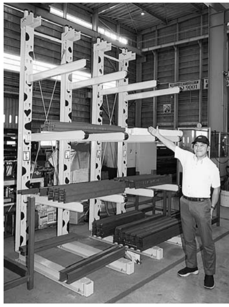
自社工場で使用しているキリンをデザインしたバーラック(ゴリキ)

主力商品であるバーラック「ピッカー」は、アームの付け根に鋳物を使用しており、高い強度が特長。