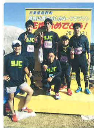
▲社内チームでマラソン大会に出場