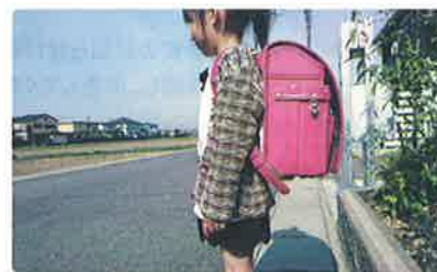
贈られたランドセル▶

社員の子育てにおける大変なこと、嬉しいことを共有していきたいという社長の思いから、家族にかかる制度も多く導入されています。そのひとつに「入学おめでとう制度」があり、小学校入学時にランドセルを贈ったり、中学校入学時に制服費用を補助されています。