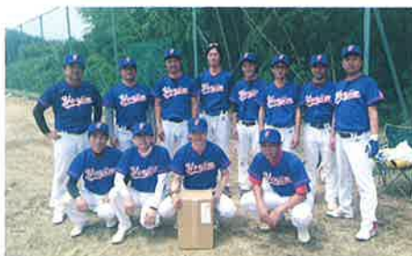
▼社内ソフトボールチーム

中小企業の最大の利点はチームワークという考えのもと、「チーム達成報奨金」という制度を設けています。3人以上でチームを作り、会社が推奨するスポーツ大会に出場することを支援する制度ですが、社員からも参加したい大会等の提案がされるなど、コミュニケーションのきっかけにもなっています。また、社内でソフトボールチームを結成し、大会にも出場されています。