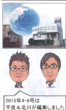
2015年4-6号は 平良&北川が編集しました