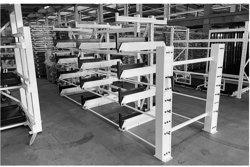
手動式スライドラック「GSH Light」